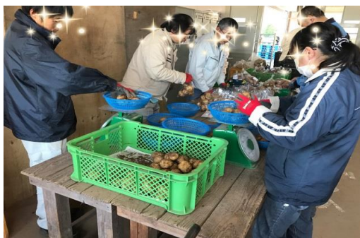
いずみ青果(株)での作業の様

平成28年12月から出水市公設市場「いずみ青果」様で、野菜及び果物等の袋詰め作業を実施することになりました。