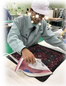
クリーニングでのアイロンがけ