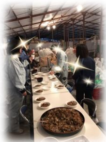
恒例のバーベキュー大会