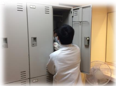
一興商事での清掃体験